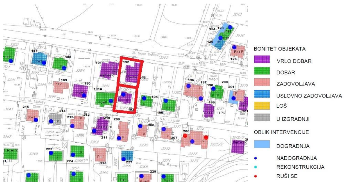
Karta plana intervencija