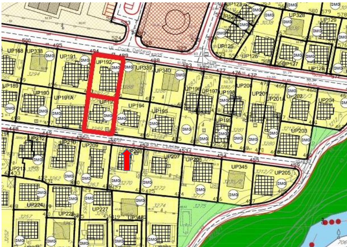
Karta namjena površina - planirano stanje