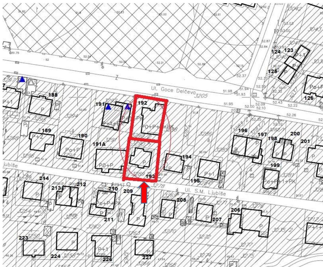
Karta postojećeg stanja