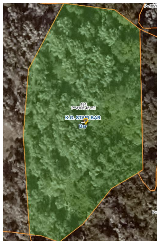
PRIKAZ LOKACIJE SA GEOPORTALA