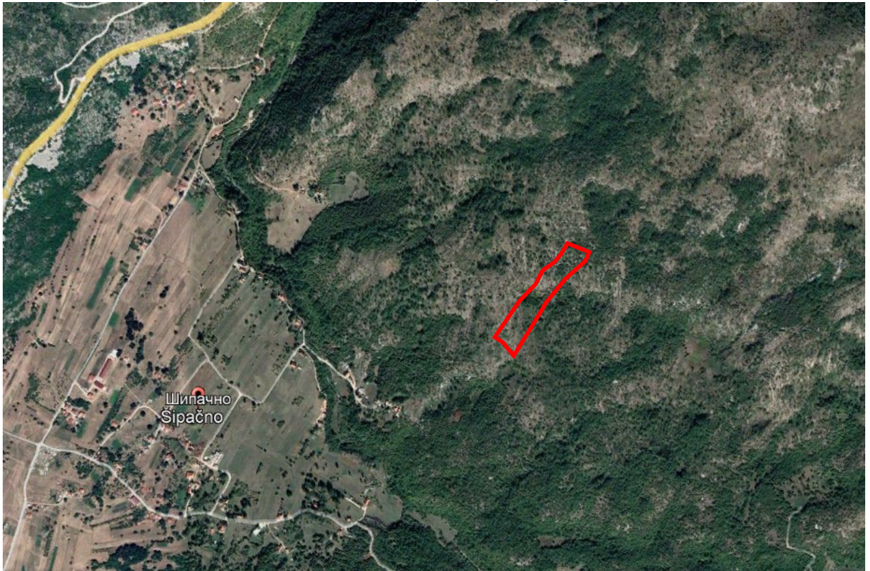
Satelitski snimak predmetne lokacije (Google Earth) Uže okruženje