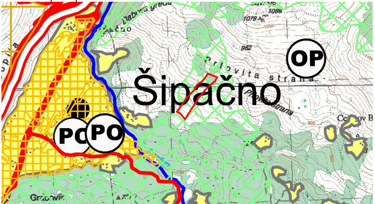
Izvod iz PUP-a Opštine Nikšić - grafički prilog- Plan namjene površina

Lokacija koja obuhvata predmetne parcele je obrađena kroz planski dokument Prostorno-urbanistički plan opštine Nikšić.